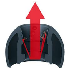
<イヤピース断面図>

イヤピース内壁に設けたディンプルにより、音質劣化の原因となるイヤピース内の反射音を拡散させることで、音のにごりを抑制し、クリアなサウンドを実現する「スパイラルドットイヤピース」を採用。耳に最適にフィットする大きさを選べる、5つのサイズ(S、MS、M、ML、L)を付属します。