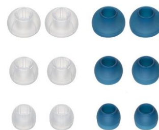
<低遮音イヤークーピース> <標準イヤークーピース>